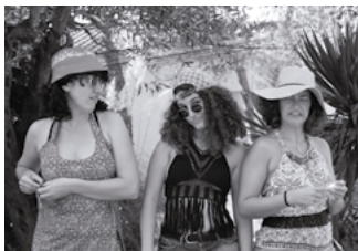
Fotografia: Las Tabus

tacontes en dues parts: la primera explicarà contes del llibre Tudos Fazemos Tudo de Madalena Matoso, que trenca amb els rols de gènere establerts entre nosaltres. La segona part consistirà a dissenyar un conte entre tothom, amb cartolines i material que generaran un àlbum il·lustrat col·lectiu, i reflectirà allò que hem après. Observacions: Cada infant disposarà del seu material individual.