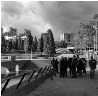
Fotografia: El globus vermell

L'itinerari començarà al barri de Canyelles, passarà pel parc Central de Nou Barris -on descobrirem diverses restes patrimonials- i pel conjunt de cases barates de Can Peguera, i acabarà a la Seu del Districte.