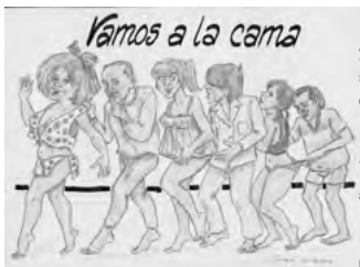
Fotografia: Josep Callejón

El temps, els anys, els quilos..., passen i pesen per a tothom, inclosos els herois i els personatges dels nostres tebeos. Josep Callejón porta anys fent dibuixos, tant de còmics com de caricatures, i actualment en té un recull de més de sis-cents. En aquesta exposició en veurem una petita mostra!