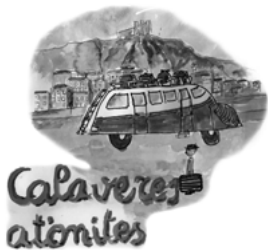
Fotografia: Les 7 tocades

que s'imaginava. A la sala del jutjat, l'esperen un seguit de personatges estrafolaris i situacions surrealistes. L'autor fa un retrat punyent i ple d'ironia d'aquests anys de postguerra. Direcció de Marina Bernat.